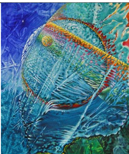
Étoile de la mer 20 x 24 po – acrylique

De la vue à la vision, il n'y a qu'un saut quantique.