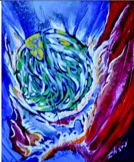
Petit cosmos n° 5 10 x 12 po – acrylique