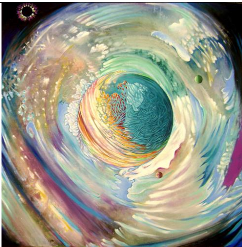
Planète 36 x 36 po – acrylique et huile